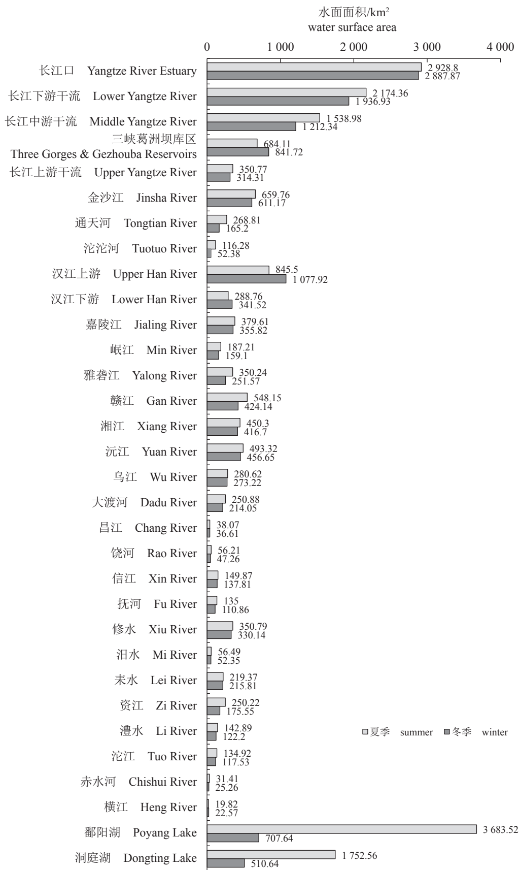
图3 长江流域重点河流消落区状况