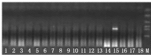
图 2 混养前几个家系的 WSSV 感染情况

对每个家系取的 5 尾虾进行巢式 PCR 检测,结果显示全部呈阴性(部分检测结果见图 2),表明所有家系在混养时不携带 WSS 病毒。