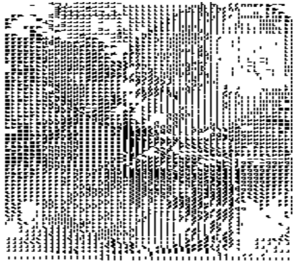
图 2 提取的鲤鱼胆汁、血清免疫球蛋白及人的免疫球蛋白工作标准液(IgM)经巯基乙醇 \alpha -ME 解离后的层析图(HPLC)