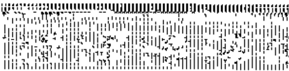
图 2 四种牡蛎四引物 RAPD 产物电泳图