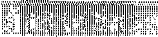
图 1 四种牡蛎 RAPD 产物电泳图

表 1 是 4 种牡蛎的种间遗传距离。图 3 和图 4 是表 1 的数据由邻接法 (Neighbor-joining)和类平均法(UPGMA)分别构建的系统树。两种方法构建的聚类图没有大的差异。